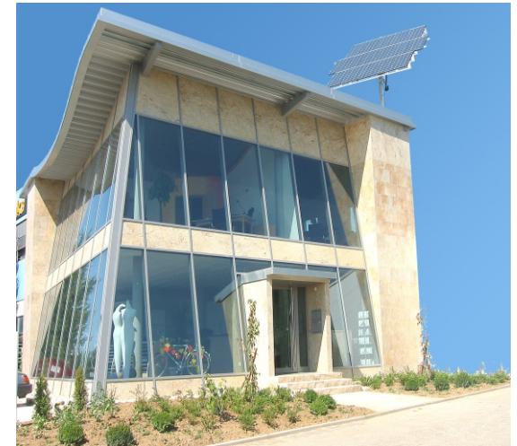
Firma Bauer in Wolfschlugen 2x 2KW Anlage mit 32 Solar-Elementen