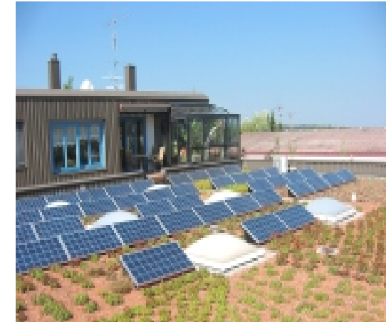
Firma Gehr in Bodelshausen 5 kW Anlage mit 40 Solar-Elementen